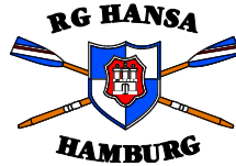
Ruder-Gesellschaft HANSA e.V., Hamburg